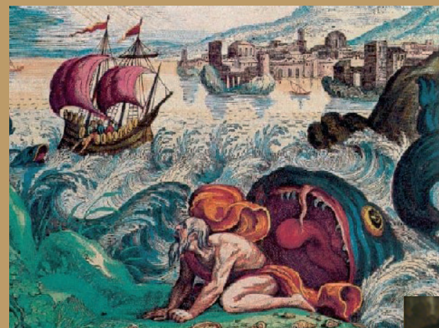
"Lève-toi, va à Ninive, la grande ville..." (Jonas, 3.2)